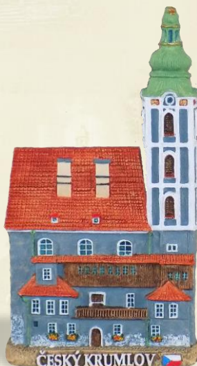
CK16 Kostel sv. Josefa

Byl založen ve 14. století. V roce 1334 byl součástí nemocnice pro chudé, kterou založil Piotr I von Rozenberg. V různých obdobích historie byl kostelem katolickým nebo protestantským. Sloužil také jako obyvatelný dům a kasino.