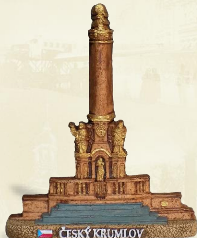
CK18 Morový sloup

Ulice Za Soudem 282. Postaven v letech 1908-1909 místní židovskou komunitou. Novorománský styl se secesními prvky. Jako modlitebna sloužil až do roku 1938. Po druhé světové válce zde byl kostel a vojenský sklad. Obnoveno v roce 2013.