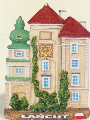
LA03 Kurza Stopka

Neobarokowy budynek, stanowiący część łańcuckiej rezydencji Potockich, choć wraz z Wozownią tworzą oddzielny kompleks hippiczny. Wzniesiona na przełomie XIX i XX wieku, otoczona parkiem. Znajduje się tu kolekcja pojazdów konnych.