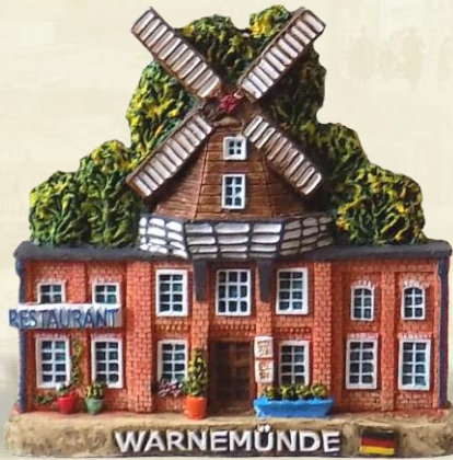
RO08 Meyer Mühle

Er wurde 1898 gebildet, ist 31 Meter hoch. Zur Zeit ist er ein von vielen Sehenswürdigkeiten des Kurorts Warnemünde.